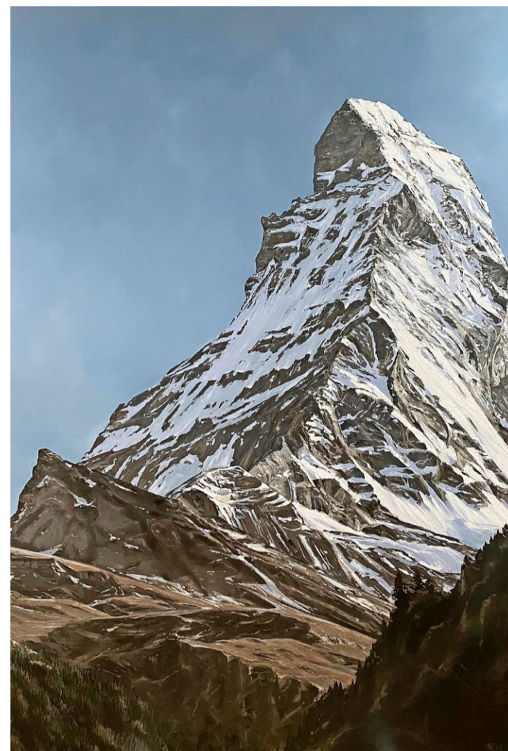
Der Berg, 2021, Öl auf Leinwand.