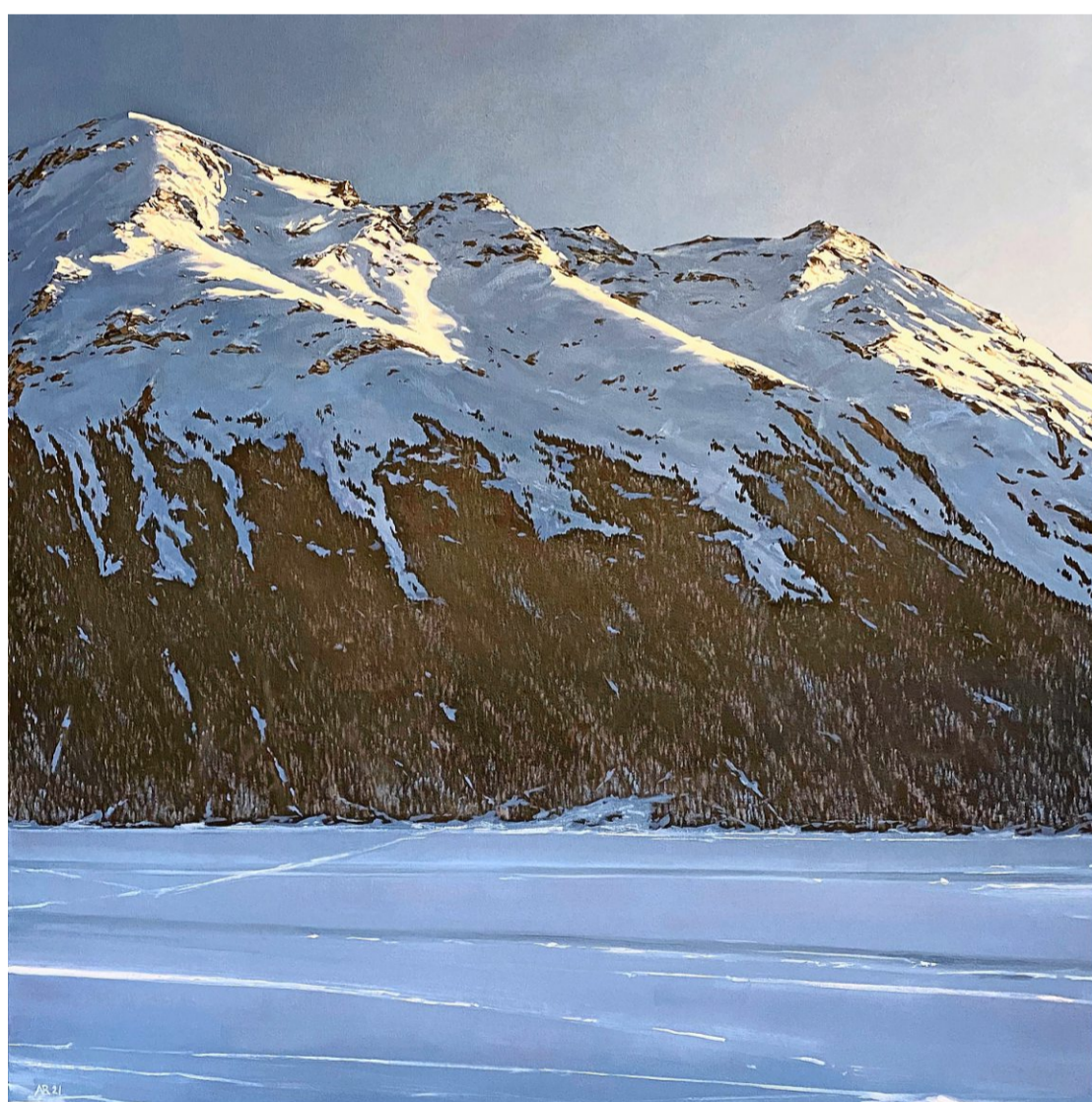
Letztes Sonnenlicht, 2021, Öl auf Leinwand.